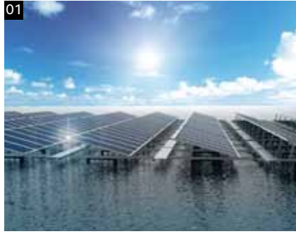
01 수상태양광 Floating PV