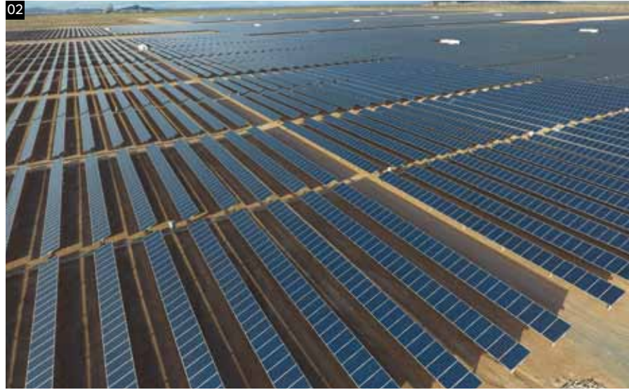
02 육상태양광 Ground PV Solution