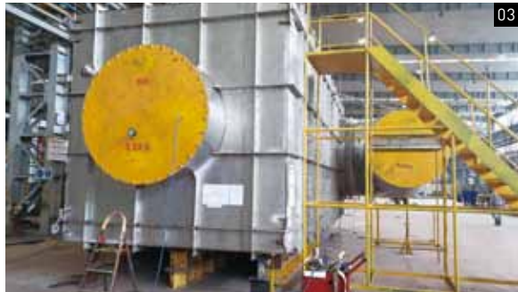
01 한주 석탄 연소 순환유동층 보일러 Hanju Coal-firing CFBC Boiler 02 현대오일뱅크 페트코크 연소 순환유동층 보일러 Hyundai Oilbank Petcoke-firing CFBC Boiler 03 선박용 스크러버 HHI-Scrubber 04 사비야 복합화력 배열회수 보일러 Sabiya CCGP HRSG